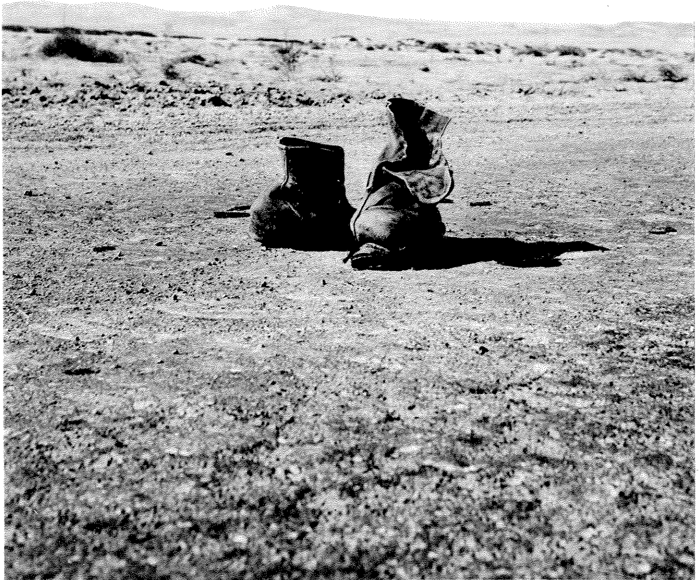
זוג נעליים מיותמות של חייל מצרי בסיני, 1956