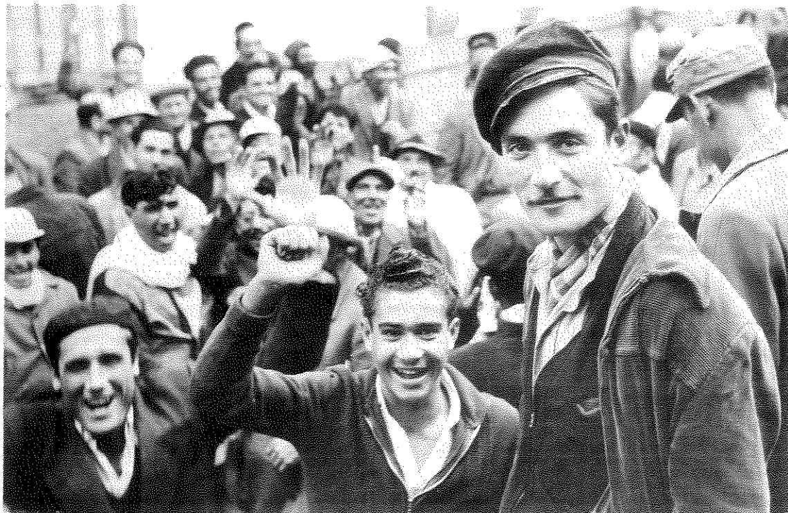
הפגנת מובטלים בעת העלייה הגדולה. הם לא כעסו, מציין כרמי