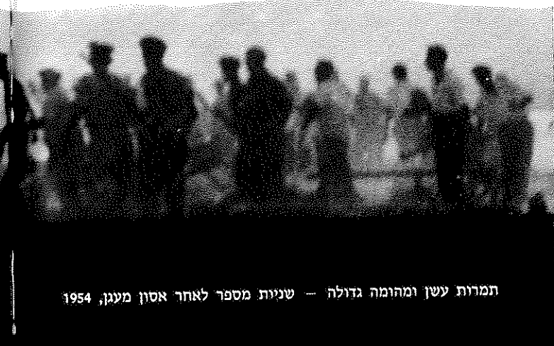
תמונות עשן ומהומה גדולה — שניית מספר לאחר אסון מעון, 1954

כרמי צילם לא רק אנשים "נודעים" — כל אדם היה בשבילו אובייקט לצילום, כל אדם הוא משהו מיוחד. הוא צילם פועלים, קבצנים ובעלי חנויות, חקלאים, דוגמניות בתצוגות אופנה, נשים נאות ואנשים שנפגש בהם באקראי בכל רחבי הארץ. וכמובן צילם גם אישים נודעים שביקרו בארץ — או נו, ראש ממשלת בורמה, הקאנצלר קונארד אדנאור, הפיסיקאי רוברט אופנהיימר או הצ'ילן