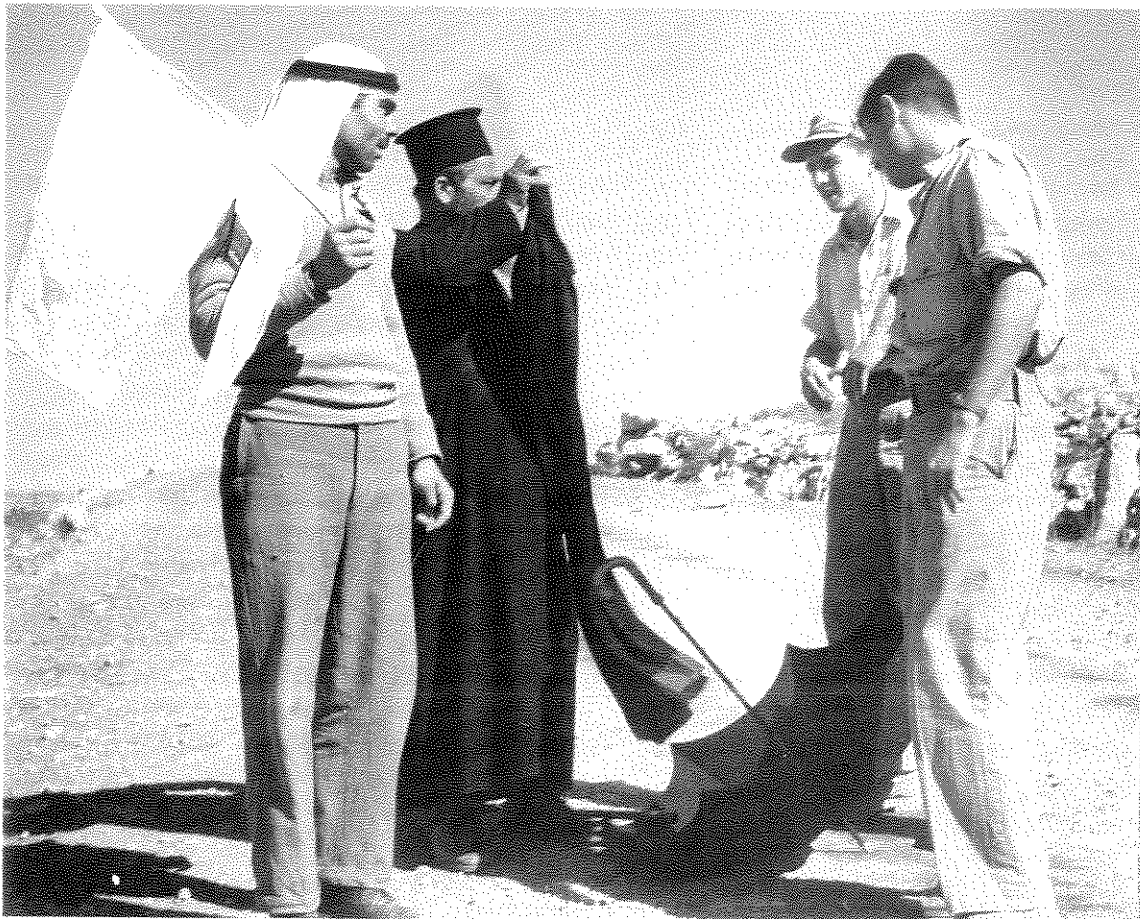
כניעה בגליל – נציגי כפר ערבי נכנעים לצוות עתונאים, 1948